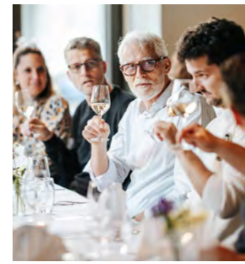
Geschichten, Genuss und spannende Gäste zum Jubiläum.

Der Limmathof ist ein Pionierbetrieb – und bis heute ein Ort mit Strahlkraft. Einer, der Menschen stärkt, Entwicklung ermöglicht und zeigt, wie wertvoll gesellschaftliche Teilhabe ist. Damit wir auch in Zukunft unserer Mission nachgehen können, freuen wir uns auf Ihren Besuch, Ihren Event oder Ihre Empfehlung. Auf die nächsten 30 Jahre Limmathof.