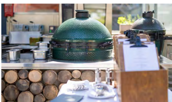
Dank eines Fundraising-Projekts entstand die «Sterneküche» im Garten der «Krone».

Viola erlebt ihre Arbeit als sinnstiftend und möchte ihre Coaching-Tätigkeit weiter ausbauen. Zudem würde sie sich über einen zweiten Peer in der Stiftung freuen.