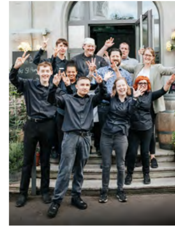
Vielen Dank an das grossartige Team des Restaurants Limmathof.