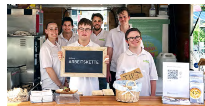
Unser Arbeitskette-Team im engagierten Einsatz an der Food Zurich.